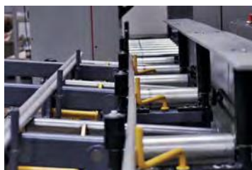
Positionnement de la barre dans l'axe de l'étau

La construction du magasin de chargement SLE permet de le personnaliser aux conditions ambiantes. Le magasin peut être flexible dans sa mise en place avec le chargement des barres soit à l'avant ou à l'arrière de l'axe des étaux de la machine (à définir à la commande).