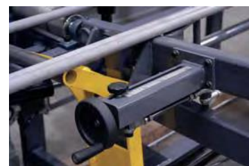
Réglage à la largeur du profilé